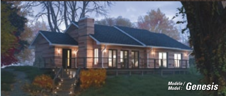
Modèle / Model: Genesis